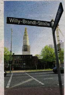
Ist dieser Blick auf St. Katharinen bald nicht mehr möglich?