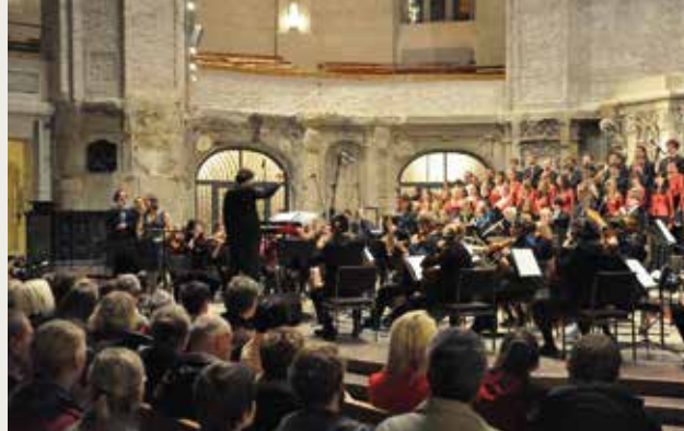
Jazz-Messe in der Dresdener Kreuzkirche im November 2011