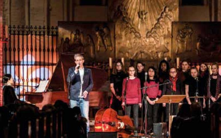
Die Jugendkantorei beim Benefizkonzert für Aleppo