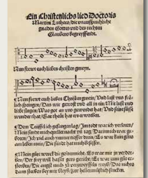
Über dieses Lied Martin Luthers schrieb Dieterich Buxtehude eine große Choralphantasie.