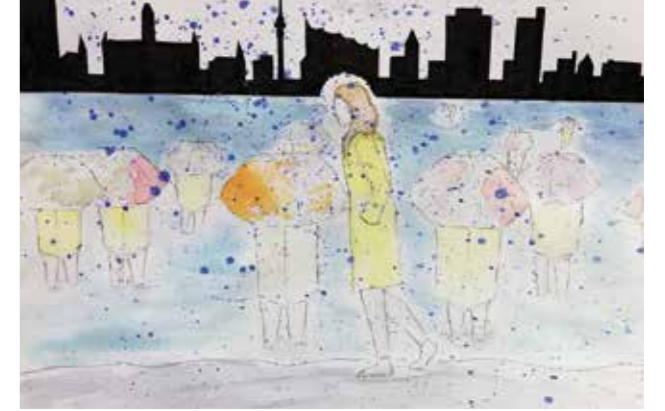
Schüler-Kunst-Ausstellung 2019 | Nils-Stensen-Gymnasium