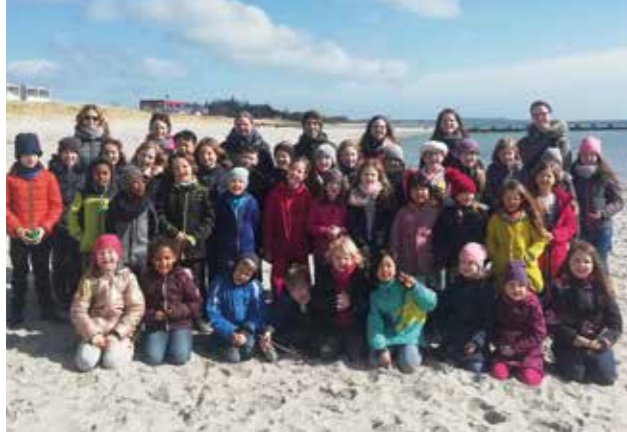
Chorfreizeit auf Fehmarn