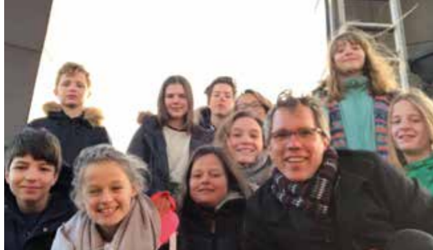
Die »Konfis« 2019