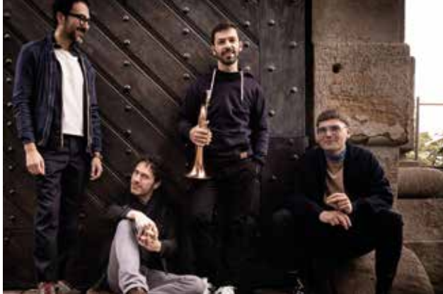
Masaa spielen am Freitag in St. Katharinen